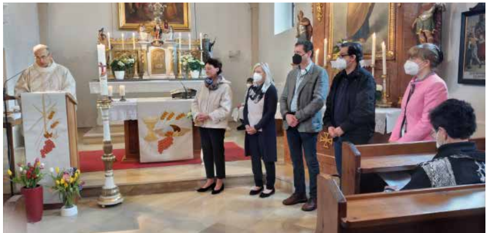
Einsatz für die Kirche. Mittendrin

Am 1. Mai 2022 wurden die Pfarrgemeinderäte der vergangenen Periode vom Amt enthoben und der neue Pfarrgemeinderat für 2022 – 2027 angelobt. Wir danken den bisherigen Mitgliedern für ihre Bemühungen um unsere Pfarre und freuen uns, dass alle weiterhin auch ohne Amt diverse Dienste versehen und unterstützend in der Pfarrgemeinschaft mitwirken. Die kommende Periode steht unter dem Motto „Mittendrin“. Mittendrin im Alltag, im Glaubensleben und im