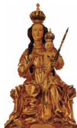
Thronende Madonna in Pöllauberg

Im Anschluss gab es die Besichtigung des Gemini-Hauses in Weiz. Dieses Haus dient nicht nur zum Wohnen, sondern es erzeugt auch Strom. Es ist ein "Sonne-Wohn-Kraftwerk". Danach ging es in die Grasl-Höhle, die durch den Tropfsteinreichtum bekannt ist. Den Abschluss bildete eine Andacht in der Wallfahrtskirche Pöllauberg. JoFe